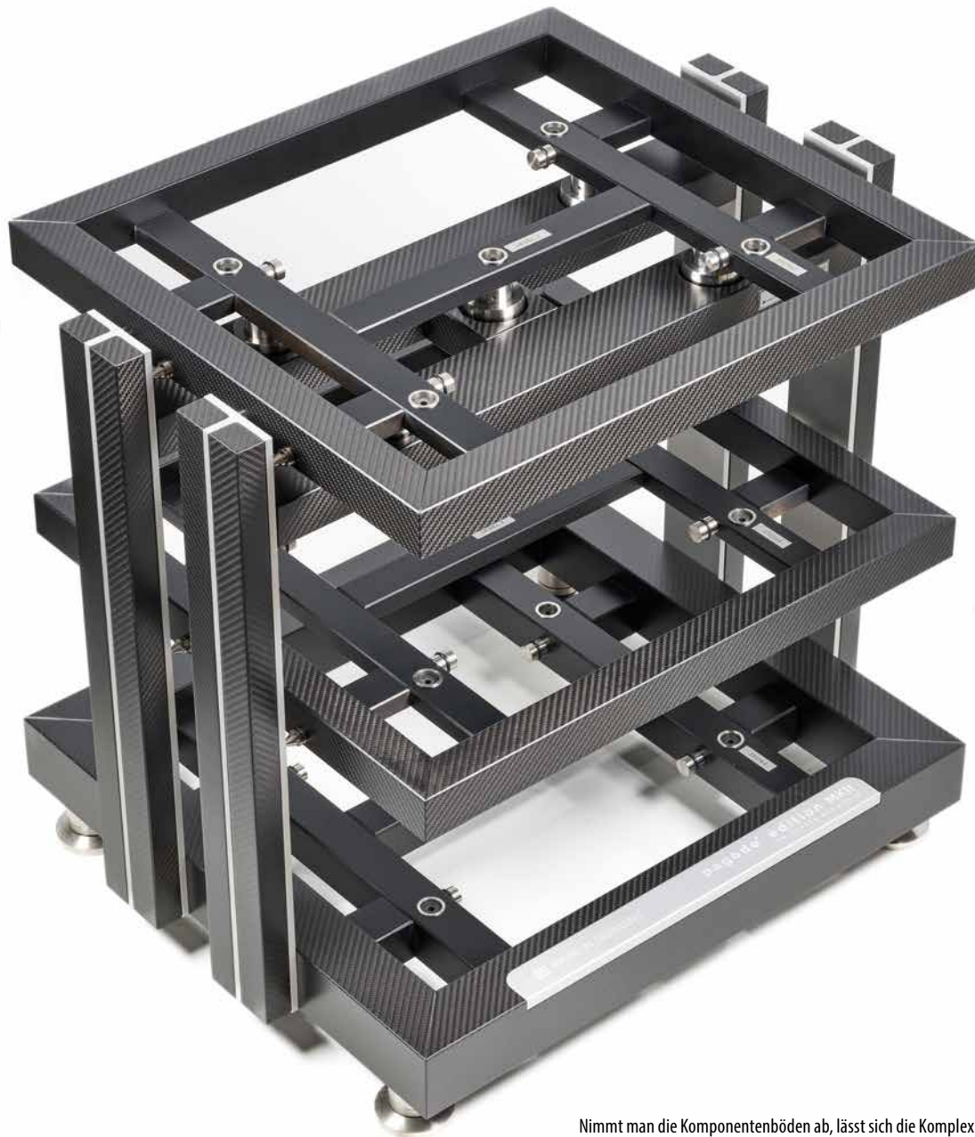
Nimmt man die Komponentenböden ab, lässt sich die Komplexität der Konstruktion zumindest erahnen. Gut zu erkennen sind im Bild die in die Tragrahmen eingelassenen Metallaufnahmen für die Keramik-Kugeln, die die Böden aufnehmen. Bei den waagrecht eingelassenen Metallzylindern handelt es sich um die Endstücke der Resonatoren, die für jede Ebene separat abgestimmt sind.

— „Three, two, one“ – länger hat's nicht gebraucht. In „Dance Dance“ ( Seven ) zählt Rei flüsternd den Takt herunter, bevor das Stück beginnt. Die erste Note ist noch gar nicht erklingen und schon jetzt muss ich gar nicht groß die Ohren spitzen, um den Unterschied zu hören; ihre Stimme ist viel fester in der Bühnenmitte verankert, wirkt in sich fokussierter und wohl dadurch auch irgendwie plastischer – was mich bei einer Flüsterstimme tatsächlich etwas überrascht. Zugegeben: Das Experiment ist ein wenig extrem. Ich hatte den Audio Note CD 5.1x